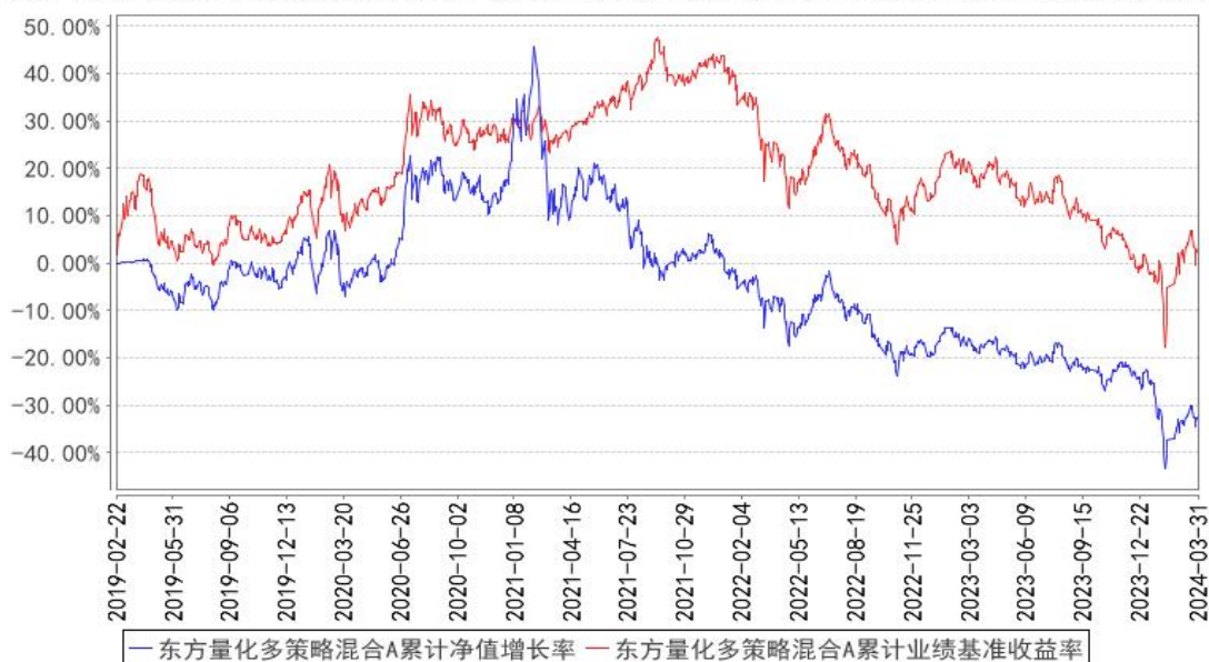
东方量化多策略混合A累计净值增长率与同期业绩比较基准收益率的历史走势对比图