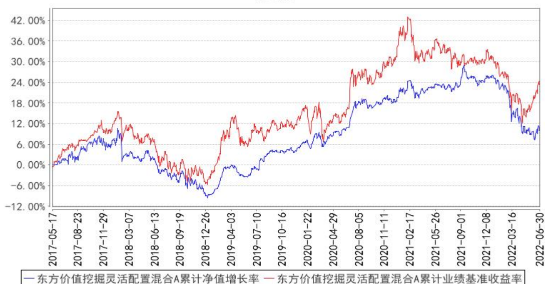
东方价值挖掘灵活配置混合A累计净值增长率与同期业绩比较基准收益率的历史走势对比图