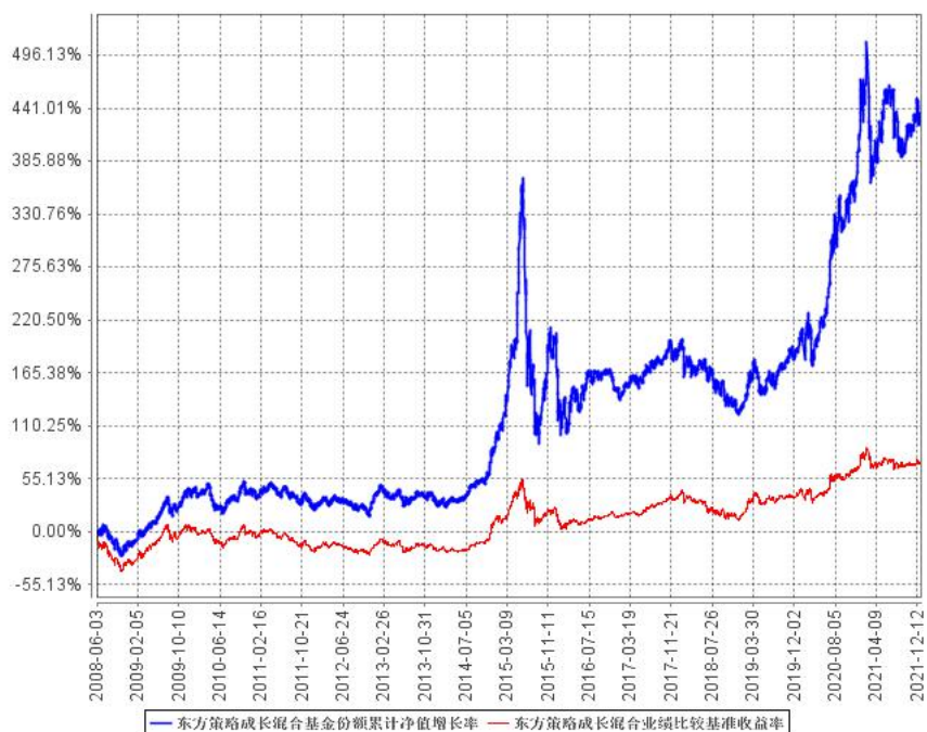
东方策略成长混合基金份额累计净值增长率与同期业绩比较基准收益率的历史走势对比图